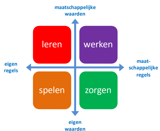
Figuur 1: Vormen van individueel en maatschappelijk gedrag

waarbij men op zoek is naar eigen regels met zingeving die wordt aangegeven door de leraar, docent, ouder of mentor. Bij werken komt zingeving en regelgeving vooral van buiten, beide worden opgelegd. Zorgen ten slotte, is een vorm van gedrag waarbij eigen waarden worden gehandhaafd en zo mogelijk overgedragen op anderen. Ieder mens kent al deze vormen van gedrag en afhankelijk van het individu en de maatschappij is er een andere balans. De combinatie zorgt ervoor dat waarden en regels worden opgenomen, overgedragen, behouden en vernieuwd via het individu en daarmee ook voor de hele maatschappij. Tegelijkertijd is er sprake van vrije expressie, lotsverbondenheid, levensonderhoud en levensverzekering. De individuele en collectieve positie in onderstaand schema zegt veel over een maatschappij.